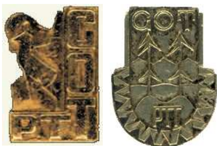
Górskie Odznaki Turystyczne (mała i duża) według projektu Stefana Osieckiego

Górska Odznaka Turystyczna PTTK jest jedną z najstarszych, polskich odznak turystycznych. Została powołana do życia przez Polskie Towarzystwo Tatrzańskie, a sama idea odznaki pojmowana była jako wyróżnik poziomu umiejętności turystycznych oraz zasób poznania gór przez jej posiadacza. Gwałtowny rozwój różnego rodzaju sportów oraz wzrost poziomu szeroko pojmowanej kultury fizycznej, po I wojnie światowej, inspirowany między innymi przez odpowiedzialne za tę dziedzinę życia społecznego organy państwa, w sposób naturalny wpłynął na zmianę tradycyjnego podejścia do turystyki górskiej. Niewątpliwą rolę odegrała w tym,