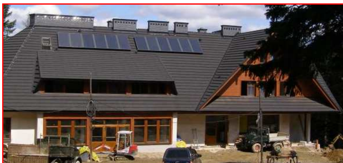
Markowe Szczawiny, 14 sierpnia 2009 r.

Opracowanie: Marian Garus Komisja Turystyki Górskiej